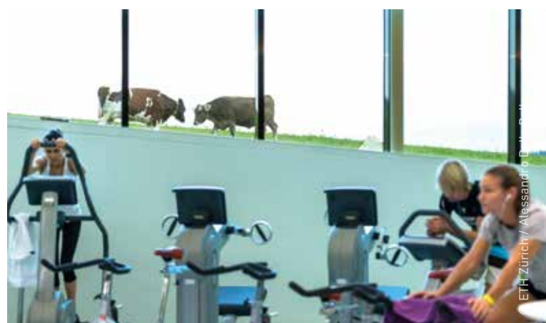
Sporthalle Campus Hönggerberg

Der ETH Link ist die schnellste Verbindung zwischen den beiden ETH Standorten in Zürich. Er verbindet die ETH Standorte Zentrum und Hönggerberg von Montag bis Freitag im 20-Minuten-Takt.