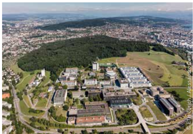
Campus Hönggerberg der ETH Zürich. Im Hintergrund: Stadt Zürich und Zürichsee