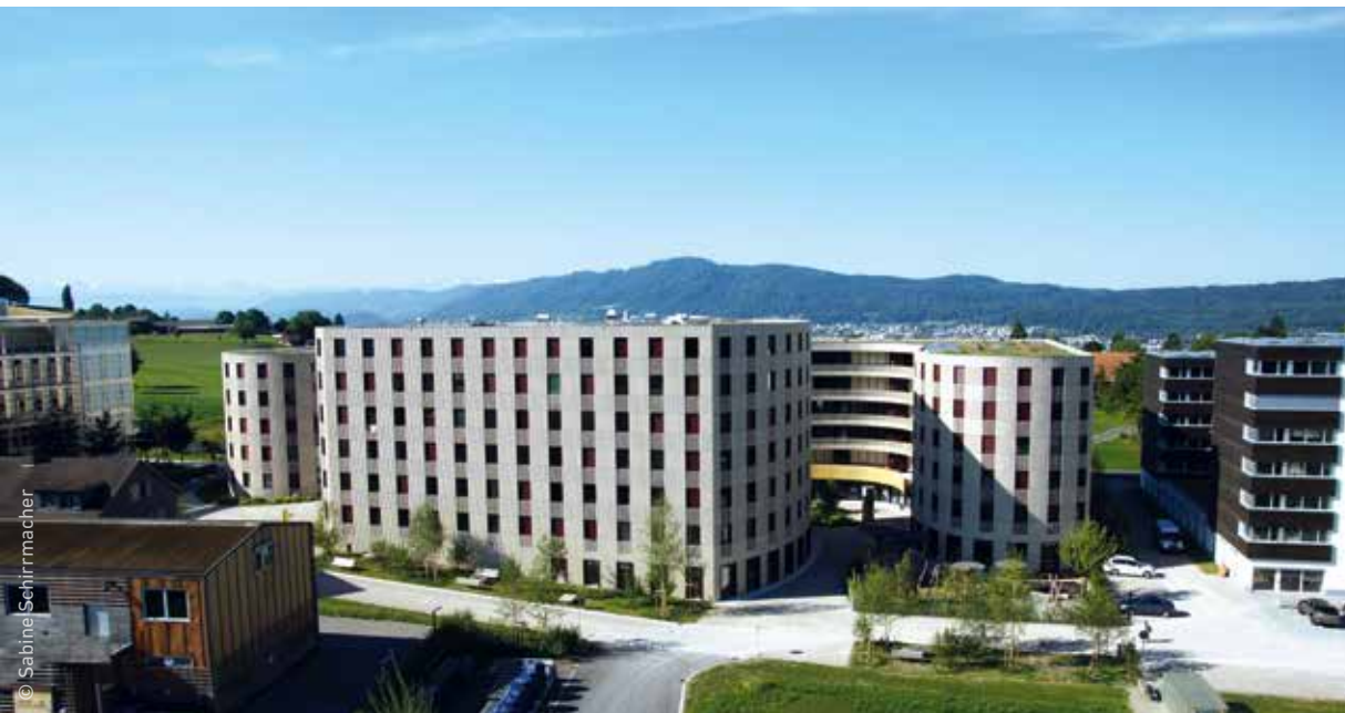
Gebäude HXE mit Studierendenbar LochNess und Wohneinheiten für Studierende.

Wer den Austausch mit den Studienkollegen bei einem Feierabendtrunk nicht missen möchte, trifft sich mit Gleichgesinnten im LochNess, der Bar der Studentenvereinigung der Bauingenieure und der einzigen Bar an der ETH Zürich von Studierenden für Studierende.