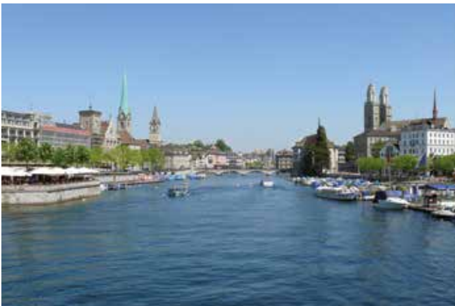
Zürich von der Quaibrücke

Es lohnt sich unter Umständen auch, die Suche nach einer Unterkunft in die Agglomeration von Zürich auszuweiten. Die Agglomeration ist mit dem öffentlichen Verkehr bestens an die Stadt angebunden.