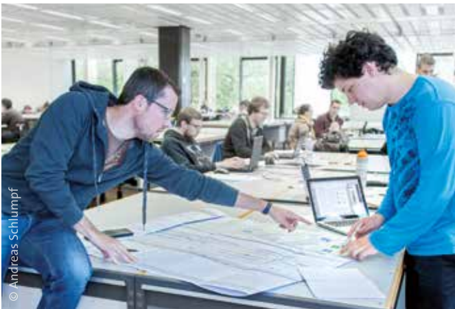
Arbeiten im Zeichnungssaal

Ein Studium an der ETH Zürich ist intensiv und anspruchsvoll. Dennoch bleibt den Studierenden bei guter Studienplanung Raum für ein «reges Studentenleben».